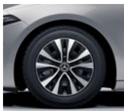
40,6 cm (16") platišča iz lahke kovine (R30)