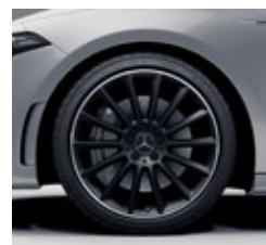
48,3 cm (19") AMG platišča iz lahke kovine (RVL)