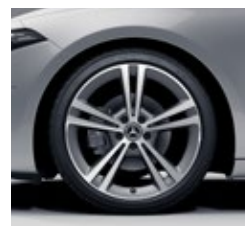
48,3 cm (19") platišča iz lahke kovine (R55)