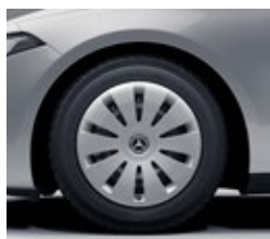
40,6 cm (16") jeklena platišča z okrasnimi pokrovi (R00)