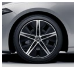
45,7 cm (18") platišča iz lahke kovine (R31)