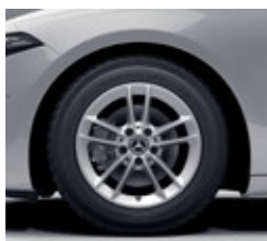
40,6 cm (16") platišča iz lahke kovine (R78)