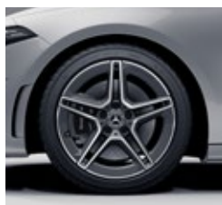
45,7 cm (18") AMG platišča iz lahke kovine (RQS)