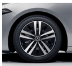
43,2 cm (17") platišča iz lahke kovine (R11)