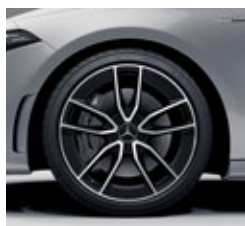
48,3 cm (19") AMG platišča iz lahke kovine (RTI)