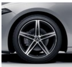
45,7 cm (18") platišča iz lahke kovine (01R)