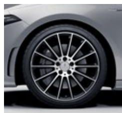
48,3 cm (19") AMG platišča iz lahke kovine (RVH)