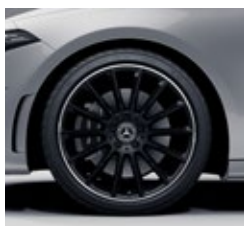
48,3 cm (19") AMG platišča iz lahke kovine (RVK)